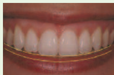
Courbe du sourire en harmonie avec la lèvre inférieure, par O. Hue, /Actualités Odonto-Stomatologiques n°238, juin 2007