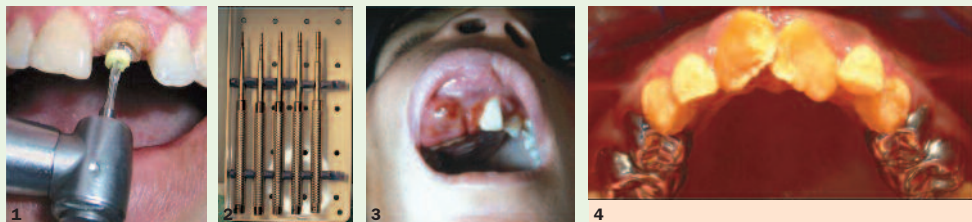
1. La mise en forme canalaire par le foret calibre adapté au diamètre du tenon choisi, ici le numéro 2. Les limites des tissus dentaires restants sont supra-gingivales, par A. Idrissi Janati, A. El Yamani, J.El Bernoussi/ Actualités Odonto-Stomatologiques n°241, mars 2008. 2. Les ostéotomes de Summers, par Y. Commissionat, G. Princ, F. Poulmaire, G. Scortecci, G. Odin, S. Berg/ Actualités Odonto-Stomatologiques n°238, juin 2007. 3. par A. Slama, Z Mziou, L. Walha, B. Sriha, H. Kochtali/ Actualités Odonto-Stomatologiques n°238, juin 2007. 4. Coiffes pédodontiques préformées, par E. Dursun, A. Beslot, M.-M. Landru/ Actualités Odonto-Stomatologiques n°242, juin 2008.

Avec la base de données CrossRef®, l'outil « Citing articles » permet de lister tous les articles citant l'article sélectionné. Ces références électroniques vous permettent également d'accéder directement à toutes les principales bases de données.